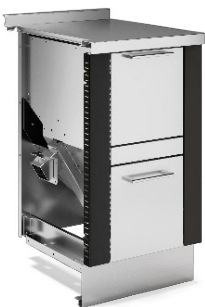
PELLET TANK Noir F5 / Inox