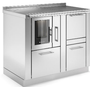
PELLET 60 PANORAMA + PELLET TANK Inox