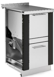
PELLET TANK Noir F5 / Inox