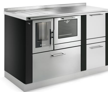
PELLET 90 PANORAMA + PELLET TANK Noir F5 / Inox