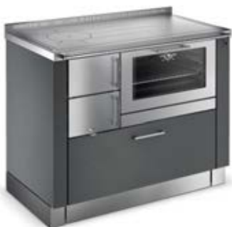
TREND Noir argent F1