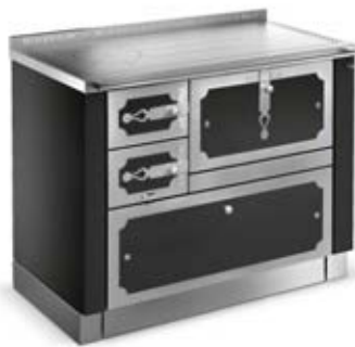
DEKOR ST04 / Schwarz F5