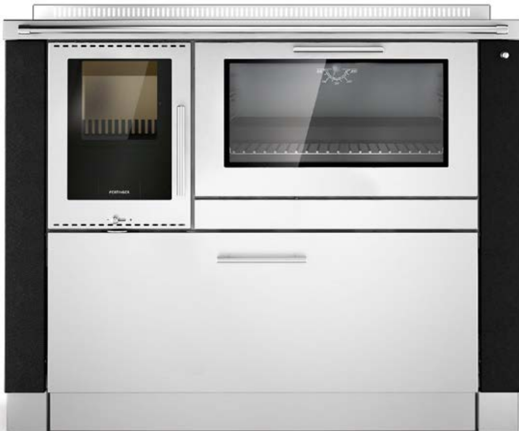
PANORAMA Schwarz F5 / Edelstahl