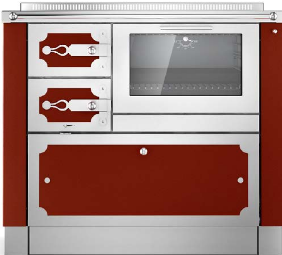
DEKOR ST04 / Rouge F6