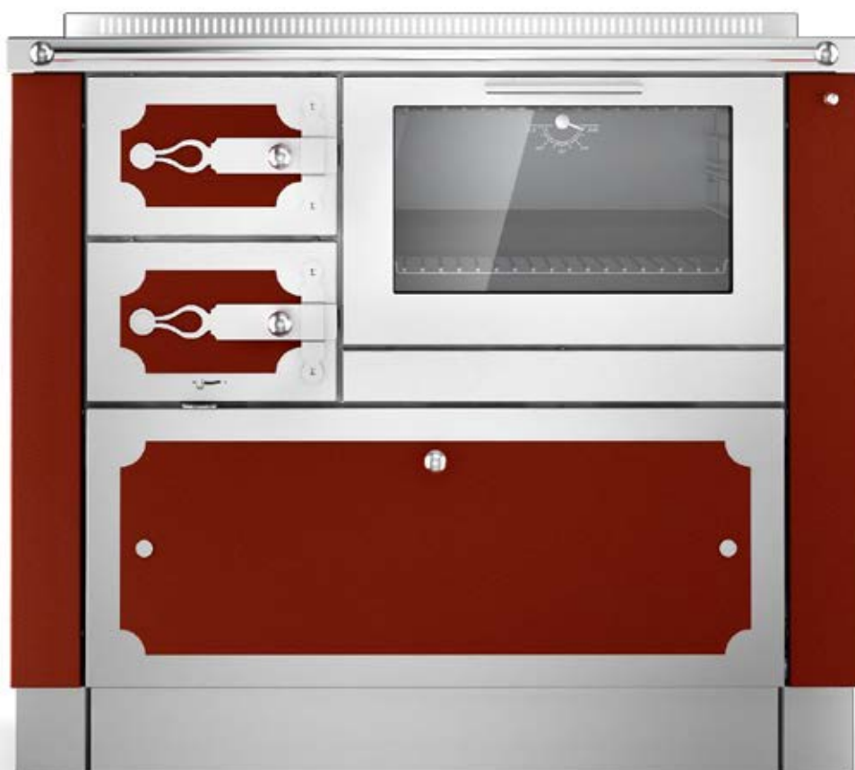
DEKOR ST04 / Rosso F6