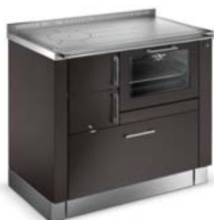
TREND Marrone grigiastro F2 Area fuoco Marrone grigiastro F2 (optional)