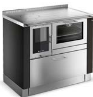
PANORAMA Nero F5 / Inox