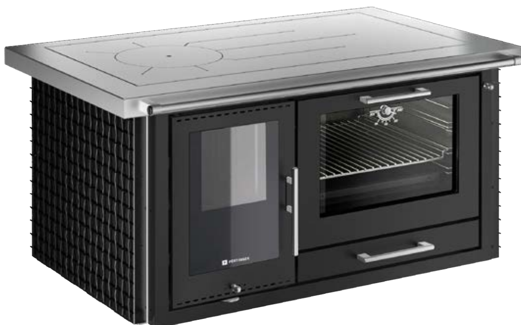
PANORAMA Dekor T10