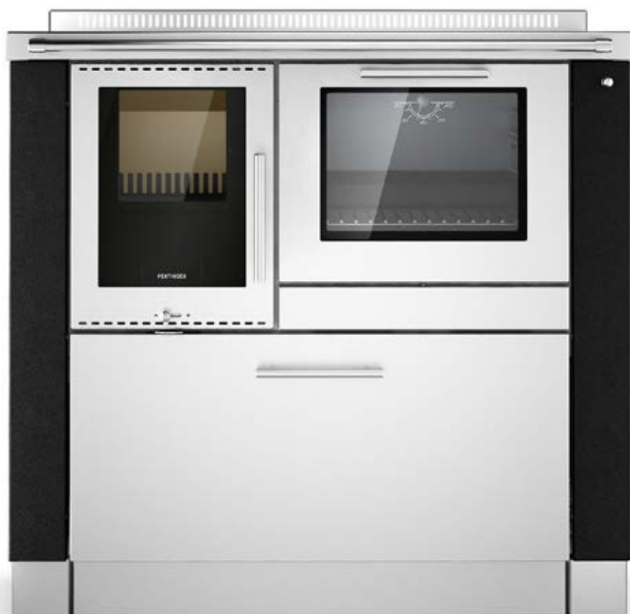
PANORAMA Nero F5 / Inox