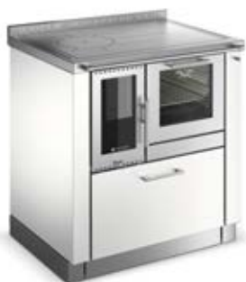
PANORAMA Weiß F8