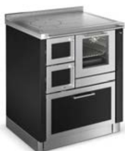
DEKOR ST21 / Nero F5