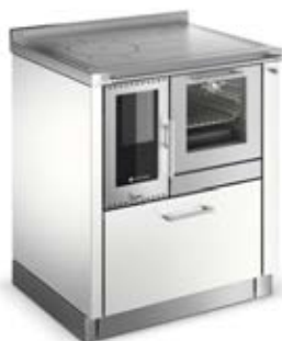
PANORAMA Weiß F8