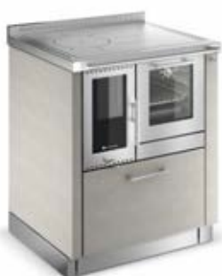
PANORAMA Sand F7